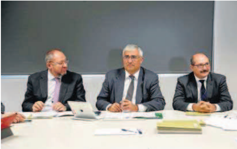
Ramírez de Arellano, en el centro, preside el consejo de la Agencia del Conocimiento.