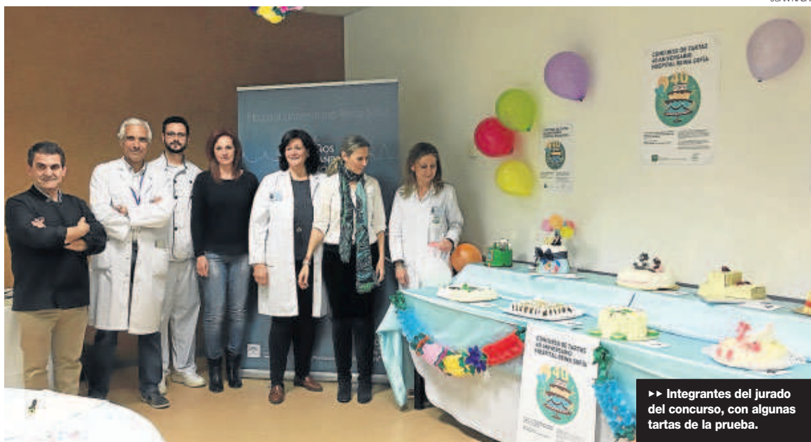
► Integrantes del jurado del concurso, con algunas tartas de la prueba.

Los más golosos ya están deseando que llegue el 3 de abril, día en el que el hospital Reina Sofía celebrará su 40 aniversario y en el que se reproducirá a gran escala la tarta que ha ganado el concurso organizado por este centro para conmemorar tan feliz efeméride. La tarta, que incorpora detalles en chocolate fondant tales como el logo del 40 aniversario y otros de uso habitual en el entorno sanitario (tales como un fonendoscopio, termómetro o pastillas) fue la que más pun-