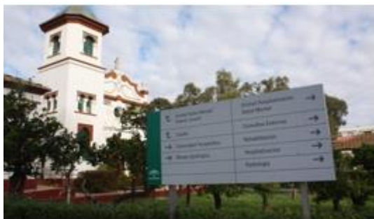
Hospital Marítimo de Torremolinos

Hospital Universitario Virgen de la Victoria (Málaga)