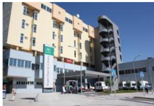
Hospital U. Virgen de la Victoria