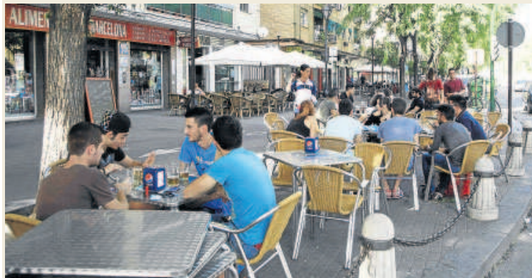
► El lector propone una mejor regulación de las terrazas a favor de los transeúntes.