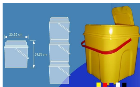
Contenedor 10 L. capacidad

Disponibles para Asistencia de Urgencias y Domiciliaria :