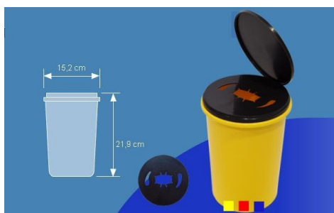
Contenedor 3 L. capacidad