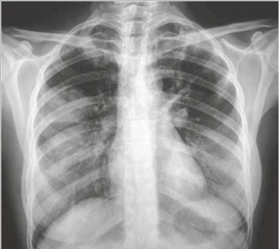
Caso Práctico 5